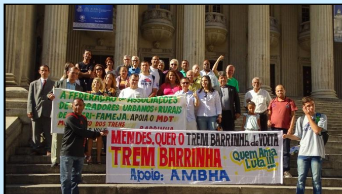
Manifestantes pró-barrinha na ALERJ.