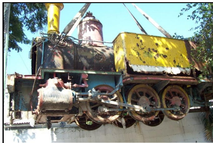
A loco 0-6-0 (uma Orenstein-Koppel?) quando do resgate.

A AFPF colaborou para aumentar esse número em uma unidade, ao resgatar, em 2011, a loco 0-6-0 da Cia Petropolitana/Ebal, hoje restaurada e posicionada no Museu Ferroviário de Nogueira, em Petrópolis/RJ.