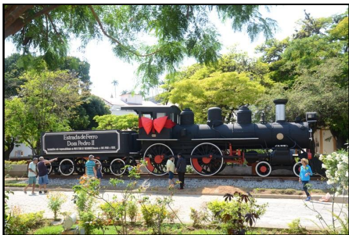
A loco #122 totalmente restaurada em Vassouras.

A Prefeitura de Vassouras contou também com o (surpreendente) apoio do IPHAN no sentido de implantar um museu ferroviário na cidade, reunindo peças de valor histórico de todas as dimensões. Parabéns aos vassourenses por essa conquista. Torcemos para que a loco não vire alvo de vandalismo por ficar exposta em praça pública. Oremos, pois!