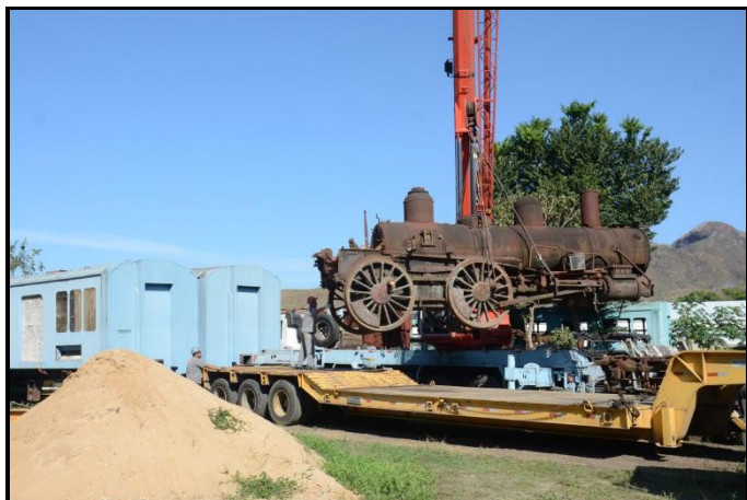
A loco #122 quando removida da T'Trans, em Três Rios.

Através de entendimentos com o DNIT e IPHAN, a Prefeitura retirou, em 17/09/2015, a 122 do pátio da T'Trans em Três Rios, juntamente com um vagão fechado de dois eixos, também da EFCB (fabricação Van Der Zypen & Charlier, Alemanha, 1902), levando-os para Vassouras para preservação estática, com planos futuros de possível restauração operacional. Tomara!