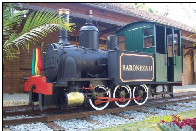
Após a reforma, a loco foi batizada Baroneza II.